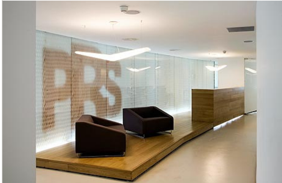
משרד המהנדסים PRS, בניין אירופה ישראל, תל אביב

"רצועות הפלסטיק נראות כמו כוורת דבורים, ואנחנו השתמשנו בהן כמחיצות בין החללים השונים במשרד. הגודל והעובי של הכוורת השתנה ביחס לצרכים של החלל. גם התקרות נבנו מהכוורת, ובחדרי העובדים ישנם מוטות הברגה, שמאפשרים לכל עובד לקבוע בעצמו את צורת התקרה בפשטות יחסית".